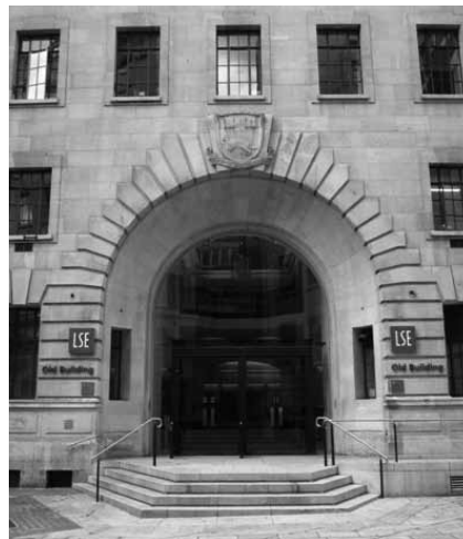
LSE Old Building

Das Kursprogramm von „International Law“ bestand in der Summer School 2011 aus einer 3-stündigen Vorlesung von 14 bis 17 Uhr und einem, den Stoff der Vorlesung wiederholenden einstündigen Kurs am Vormittag. Man muss jedoch einiges an Zeit darauf verwenden die verpflichtende Lektüre zu lesen, die durchschnittlich zwischen 50 und 120 Seiten pro Tag beträgt. Die Bewertung der Leistung erfolgte mittels eines maximal 1500 Worte umfassenden Essays, inklusive Fußnoten, und einer schriftlichen Leistungskontrolle am Ende des Kurses bei dem 3 von 8 gestellten Fragen essayartig beantwortet werden sollten. Das Notenschema entspricht nicht dem der Universität Wien, da ein F erst bei 39% beginnt, aber ein A+ schon ab 80% zu erhalten ist. Dennoch ist es keinem/r KursteilnehmerIn gelungen die Bestnote zu erreichen, zum Glück wurde auch niemand negativ beurteilt. In Bezug auf die Anrechnung der Note im Einzelfall sollte man sich an Frau Mag. Verena Haas wenden.