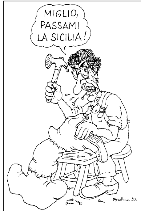
Aus: FORATTINI: Il Garante di Lady Chatterley. Mailand 1994, S. 64.

Die in Zwänge und Bedürfnisse eingebetteten „Projekte“ und Intentionen sind das zentrale Steuerelement des gesamten wahrnehmungsgeographischen Prozeßkreislaufes, unter dem keineswegs nur Vorgänge der bloßen Sinneswahrnehmung zu verstehen sind. Ein Cartoonist nimmt beispielsweise Italien als Land, das vom organisierten Verbrechen ins Schlepptau genommen wird, wahr (vgl. Abb. 1). Seine Intention ist es, diese Wahrnehmungsfacette des Staates Italien herauszugreifen und als Cartoon darzustellen. Es handelt sich dabei um eine subjektspezifische Darstellung – um eine Stigmatisierung Italiens –, die in diesem Fall allerdings auch in der Gesellschaft eine sehr breite inhaltliche Wahrnehmungsbasis besitzen dürfte. Ein weiteres Beispiel stellen die insbesondere von der Lega Nord (BOSSI) bekannten Diskussionen zur Neugliederung Italiens dar (vgl. Abb. 2).