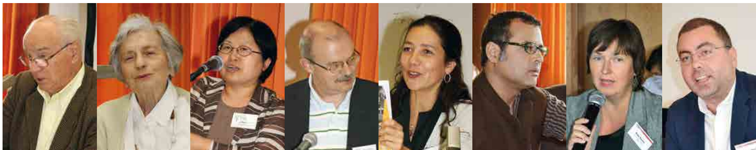
Generationen der ITH