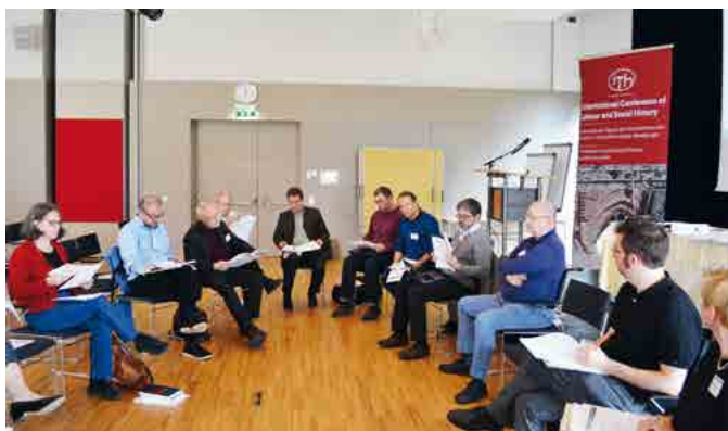
Vorstandsberatung der ITH 2017