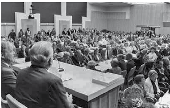
25-Jahr-Feier 1989 in Linz