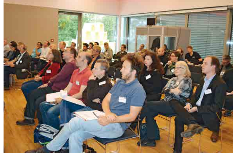
Tagungsort (AK OÖ, Jägermayrhof) und TagungsteilnehmerInnen der Linzer Konferenz