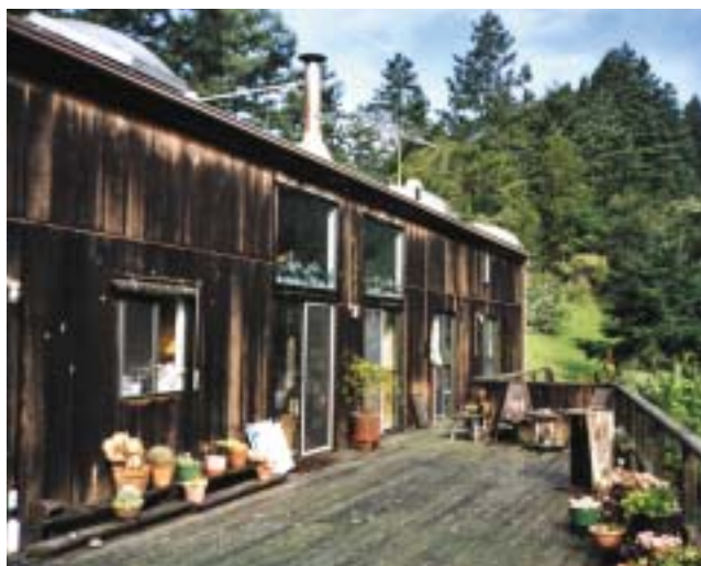
Das Haus in Pescadero, nach Plänen des Architekten Andreas von Foerster errichtet.

Symbolforschung oder Bibliothekswissenschaften sind hier Beispiele; oder der Umstand, daß Foerster der Präsident der Wenner-Gren Foundation , einer Stiftung für anthropologische Forschung, wurde. Bedeutsam sind schließlich auch die didaktischen Innovationen am BCL, die vor allem auch auf die Partizipation der Studentinnen und Studenten zielten. Publikationen wie Cybernetics of Cybernetics or the Control of Control and the Communication of Communication geben davon ein eindrucksvolles Bild. Diese didaktischen Innovationen fanden nicht immer Zustimmung. Aufgebrachte Eltern und Kollegen veranlaßten Foerster 1970, im Klima der ausklingenden Studentenrevolte, sich für einen Heuristik-Kurs zu rechtfertigen. In einer allgemeinen Krise der Forschungsfinanzierung in den Vereinigten Staaten, die durch das sogenannte Mansfield-Amendment ausgelöst worden war, kam auch das BCL in beträchtliche Schwierigkeiten.