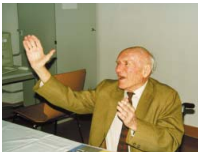
HvF bei der Eröffnung des Heinz von Foerster-Archiv, Wien, Oktober 2001