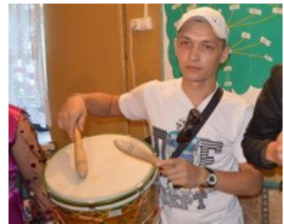
тўмыр (drum) тўмырзё тўмырым пераш (-ем)