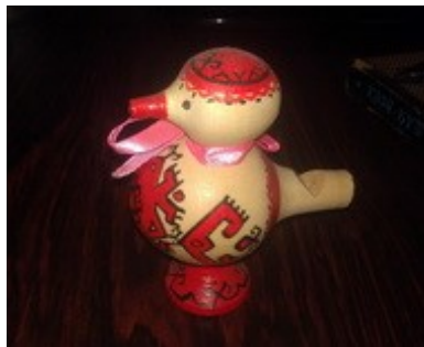
шўшпык (whistle) шўшпык дене шўшкышё шўшпык дене шўшкаш (-ем)