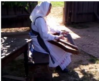
кўсле (gusli) кўслезе кўслем шокташ (-ем)

Familiarize yourself with the following musical instruments, the terms used for the person that plays said instrument, and the verbs used for playing said instruments.