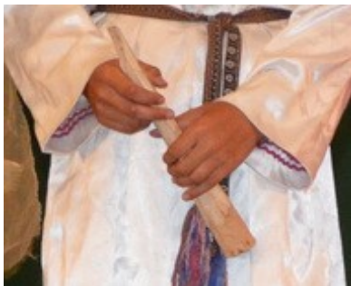
шиялтыш (pipe, fife) шиялтышче шиялтышым шокташ (-ем)