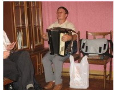
гармонь (accordion) гармоньчо гармоньым шокташ (-ем)