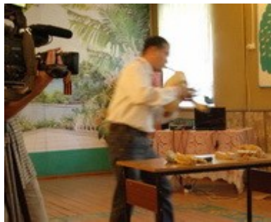
шўвыр (bagpipes) шўвырзё шўвырым шокташ (-ем)