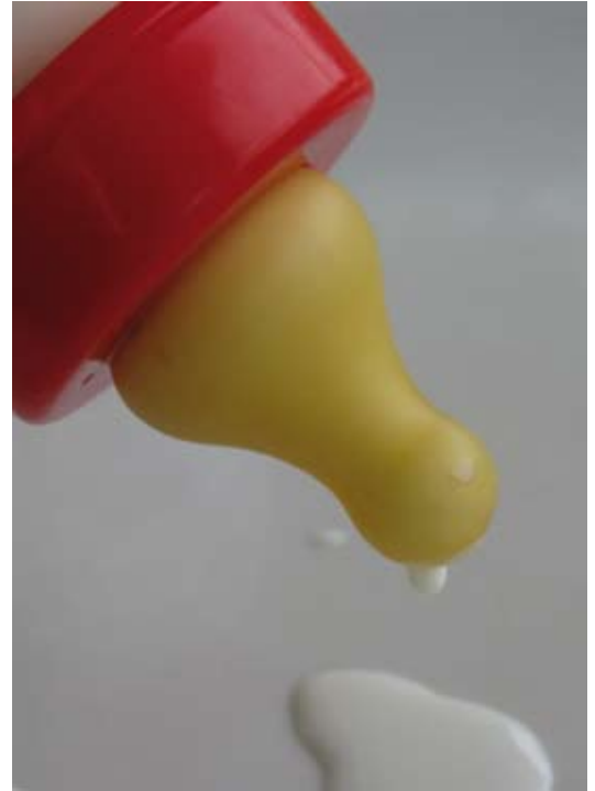
Vielfalt beim Essen - ein erstrebenswertes Ziel!

Manche Geschmackspräferenzen haben also Ursachen in den ersten Lebensmonaten. Eine Ausrede für schlechte Ernährungsgewohnheiten im Erwachsenenalter ist das dennoch nicht. Denn Vorlieben sind veränderbar – und zwar das ganze Leben lang! ■