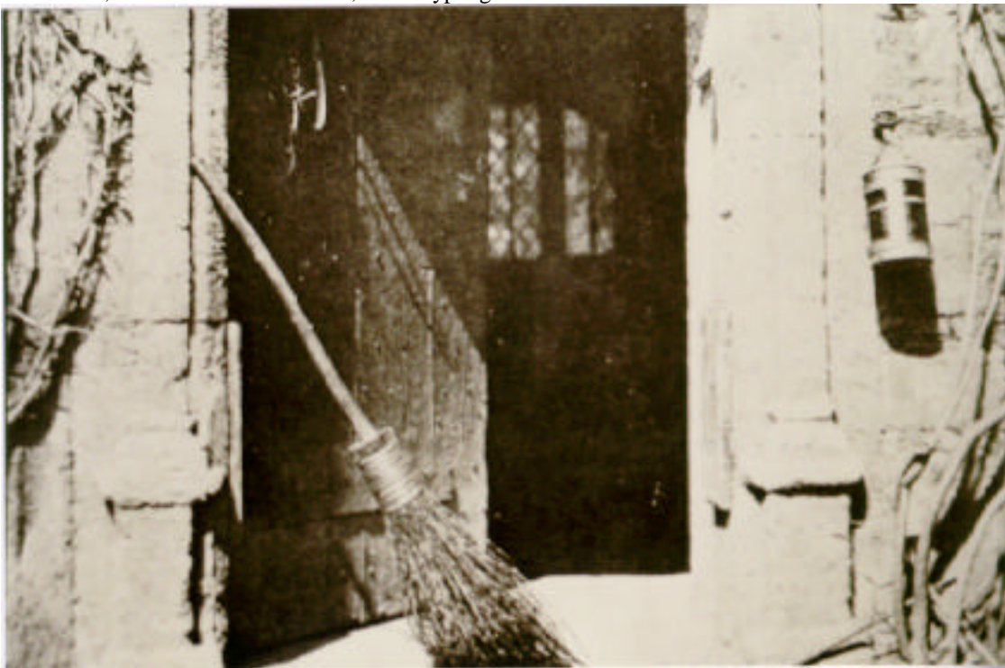
Abbildung 13: „Die offene Tür“, Salzpapierkopie nach einem Kalotypienegativ, H.F.Talbot ca. 1844

Die Kalotypie ist eigentlich nur eine Weiterentwicklung der photogenischen Zeichnung. Sie besitzt jedoch zwei derart gravierende Unterschiede gegenüber ihrer Vorgängerin, dass ein neuer Name durchaus gerechtfertigt scheint. Erstens wurde die Lichtempfindlichkeit so stark erhöht, dass nun auch Personen abgebildet werden konnten. Durch die Veränderung der lichtempfindlichen Substanz musste ein Entwicklungsbad eingeführt werden, da durch die Belichtung in der Kamera entweder kein oder nur ein sehr schwaches Bild zu sehen war. Das Bild erschien erst im Entwicklungsbad. Die photogenische Zeichnung und die Kalotypie besitzen folgenden Nachteil: Das Papier als Trägersubstanz des Negatives zerstreut das Licht, welches beim Umkopieren durch das Negativ geht. Daher erhält man ein „weiches“ sprich nicht besonders scharfes Bild. Sowohl die Kalotypie als auch die photogenische Zeichnung werden oft, zu Ehren ihres Erfinders, Talbottypie genannt.