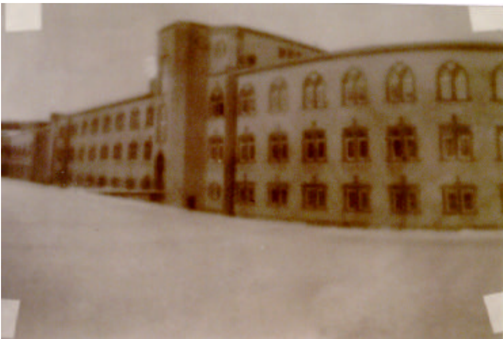
Abbildung 15: Seitenverkehrtes Positiv vom Negativ aus Abbildung 14, ohne Filter

Nun lege ich bei Dunkelkammerbeleuchtung ein unbelichtetes Fotopapier mit der beschichteten Seite nach oben unter den Vergrößerer oder unter die noch ausgeschaltete Lichtquelle. Darauf lege ich nun das Negativ. Liegt das Negativ so, dass das Bild sichtbar ist, erhält man nach der Belichtungszeit von circa 15 s bei Blende 2,8 und der anschließenden Entwicklung ein Positiv, welches wieder seitenverkehrt ist. Außerdem ist das Positiv nicht so scharf, weil das Licht auf seinem Weg durch das Papier noch einmal gestreut wird.