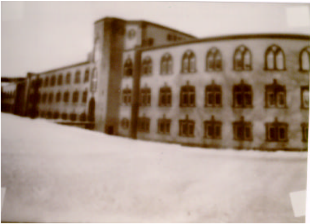
Abbildung 16: Seitenverkehrtes Positiv vom Negativ aus Abbildung 14, mit Magenta-Filter

Ein seitenrichtiges Bild erhält man, wenn das Bild mit der Rückseite nach oben auf dem noch unbelichteten Fotopapier liegt. Das Bild ist dann auch schärfer und die weißen Flecken, die durch die am Negativ aufgeklebten Fotoecken verursachten werden, sind nicht so stark sichtbar. In meinem Falle benötigte ich eine Belichtungszeit von 15 s bei Blende 2,8. Der Vergrößerer befand sich gerade so hoch, dass das Bild gut ausgeleuchtet war, circa 40 cm über dem Fotopapier. Durch Zugabe eines Magenta-Filters können auch hier die Kontraste deutlich erhöht werden. Allerdings erhöht sich dadurch die Belichtungszeit auf circa 30 s. Nach dem Entwickeln hält man ein positives, seitenrichtiges Bild in Händen, welches nach dem Verfahren der Kalotypie, unter Verwendung moderner Hilfsmittel, hergestellt wurde.