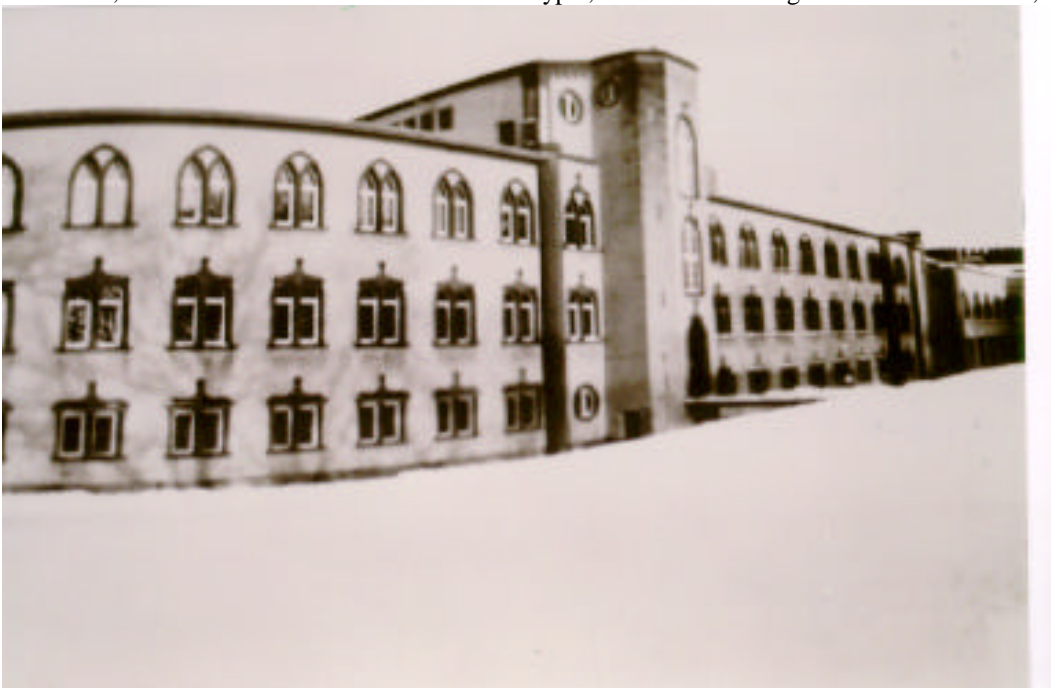
Abbildung 17: Seitenrichtiges Positiv vom Negativ aus Abbildung 14, mit Magenta-Filter

Ein seitenrichtiges Bild erhält man, wenn das Bild mit der Rückseite nach oben auf dem noch unbelichteten Fotopapier liegt. Das Bild ist dann auch schärfer und die weißen Flecken, die durch die am Negativ aufgeklebten Fotoecken verursachten werden, sind nicht so stark sichtbar. In meinem Falle benötigte ich eine Belichtungszeit von 15 s bei Blende 2,8. Der Vergrößerer befand sich gerade so hoch, dass das Bild gut ausgeleuchtet war, circa 40 cm über dem Fotopapier. Durch Zugabe eines Magenta-Filters können auch hier die Kontraste deutlich erhöht werden. Allerdings erhöht sich dadurch die Belichtungszeit auf circa 30 s. Nach dem Entwickeln hält man ein positives, seitenrichtiges Bild in Händen, welches nach dem Verfahren der Kalotypie, unter Verwendung moderner Hilfsmittel, hergestellt wurde.