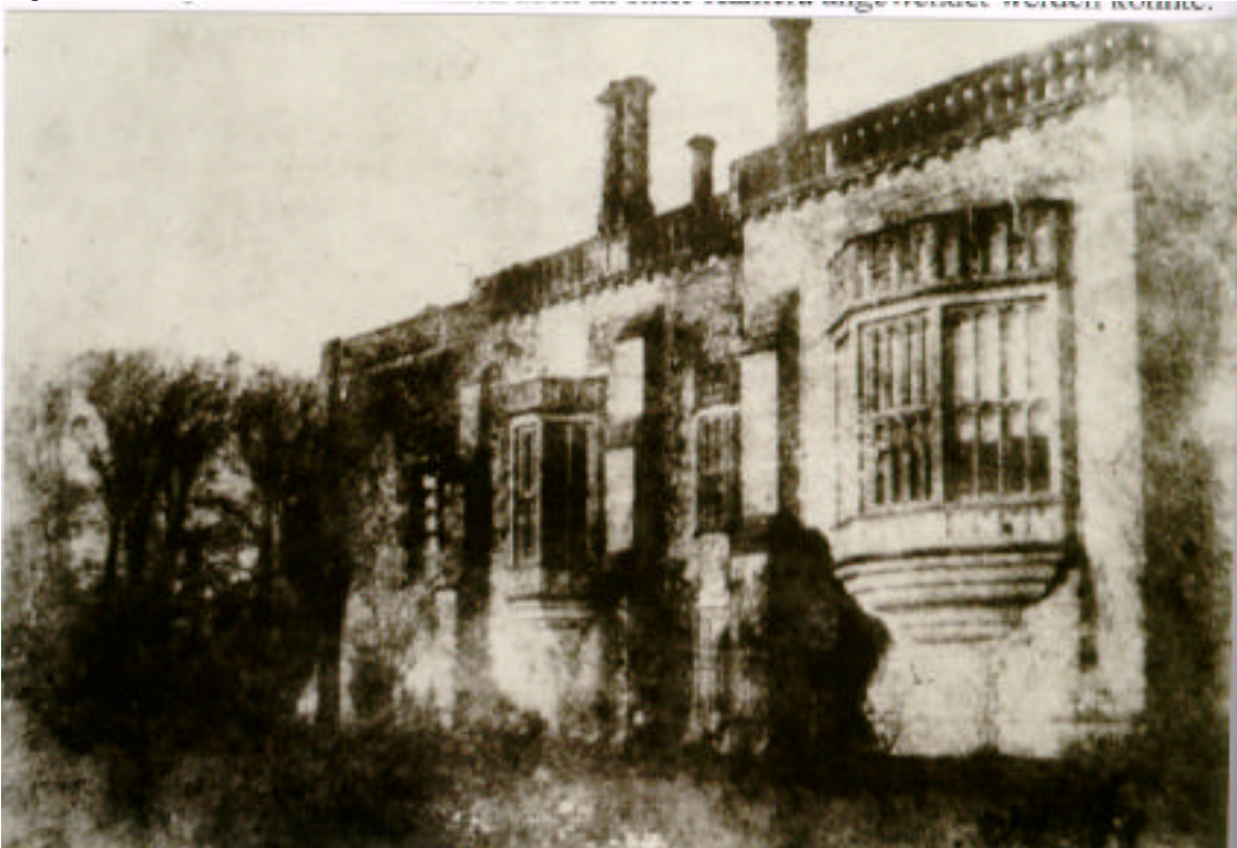
Abbildung 12: Lacock Abbey, photogenische Zeichnung von H.F. Talbot, vermutlich 1839

In seinen ersten Versuchen verwendete Talbot das Verfahren, welches Wedgwood 13 schon angewandt hatte. Er benutzte Schreibpapier, welches durch Silbernitrat lichtempfindlich gemacht wurde, um Silhouetten von Gegenständen, die er auf das Papier legte, herzustellen. Schon bald kam er auf die Idee von seinen Bildern Kopien anzufertigen, die dann ein Negativ eines Negatives, also ein Positiv waren. Die Idee des Negativ-Positiv-Verfahrens, das die Fotografie bis heute prägt, war geboren. Doch vorerst scheiterte er an der Fixierung seiner Bilder. Als auch dieses Problem der Fixierung gelöst war, musste nur noch der Beweis erbracht werden, dass dieses Verfahren auch in einer Kamera angewendet werden konnte.