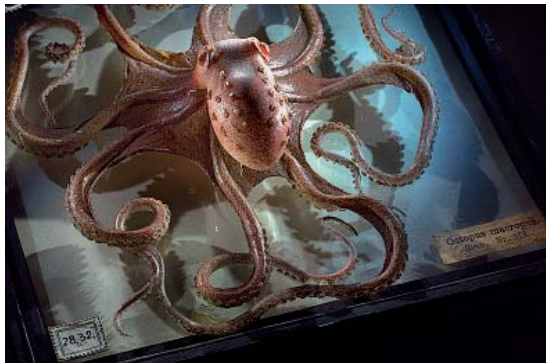
Octopus vulgaris , Blaschka-Glasmodell, um 1885