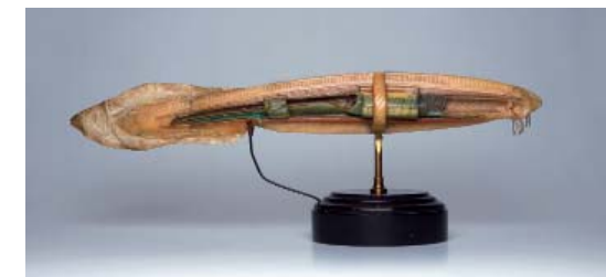
Anatomisches Modell von B. lanceolatum , Unikate, den Zieglerischen Wachsmodellen nachempfunden, um 1900

Die Vorträge versuchen, neben der historischen Entwicklung der Zoologischen Sammlung im Lichte der Veränderungen der Gesamtuniversität, auch auf die aktuellen Probleme der Existenzberechtigung von Sammlungen allgemein, wie speziell im universitären Kontext aufmerksam zu machen und gleichermaßen zukunftsorientierte Lösungsansätze für die Wiener Universität zu diskutieren.