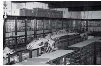
ehemaliger großer Sammlungssaal, 1982

Biologische Sammlungen an Universitäten und Museen haben sich von Belegkollektionen der systematischen Entdeckung und Erfassung der Natur im 19. Jahrhundert zu