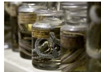
Depot der Feuchtsammlung

Die Zoologische Sammlung in Wien ist eine universitäre wissenschaftliche Vergleichssammlung für Forschung und Lehre. Ihr Bestand, der seit 1982 räumlich im Universitätszentrum Althanstraße (UZA1) untergebracht ist, setzt sich aus etwa 460.000 Einzelobjekten zusammen (110.000 Feuchtpräparate und 350.000 Trockenpräparate), die durchwegs zoologisch-systematisch aufgestellt sind. Das