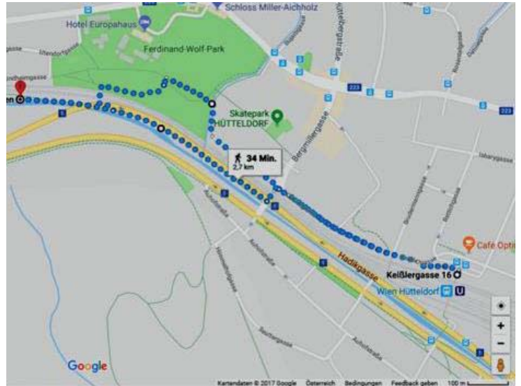
Abbildung : Google Maps Ansicht der phykologischen Exkursionsroute, welche an der U4 Station Wien Hütteldorf beginnt und zur renaturierten Strecke des Wienflusses führt - (A) U4 Station Wien Hütteldorf, Keißergasse 16; der Eingang der Station ist der Beginn der Exkursionsroute; (B) der Halterbach am Ferdinand-Wolf-Park; (C) Die nicht-renaturierte Strecke des Wienflusses; (D) Ende der Route - die renaturierte Strecke des Wienflusses.

Wir freuen uns über zahlreiche Teilnahme und bitten um Anmeldung per E-mail bis spätestens 3 Tage vor Exkursionsbeginn.