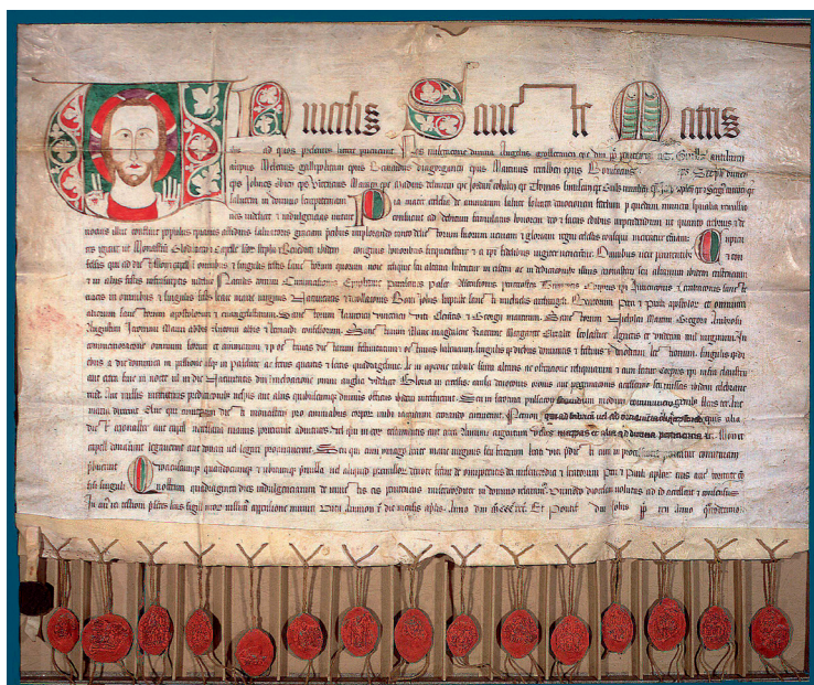
図6 北ドイツのメンヒェングラートバッハ修道院への参詣者に対する一括贖宥状（アヴィニョン、1330年4月10日）。キリストの胸像が、免償を象徴している。

かけてくれるのだという新しい思想は、まだ人々の意識の中心を占めてはいなかったのである。