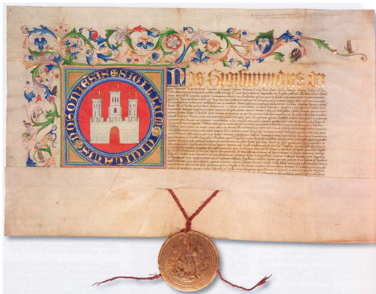
図5 神聖ローマ皇帝ハンガリー王ルクセンブルク公ジギスムントがブラティスラヴァ市に下賜した紋章（ペーチ、1436年7月8日）