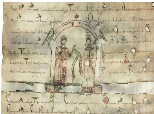
図4 パーリ（南イタリア）での1028年12月の結婚契約書

そのため、私たちは個々のケースについて、いったい誰が、なぜ、誰のために、そのような挿絵を添えたのかを、検討しなければならない。