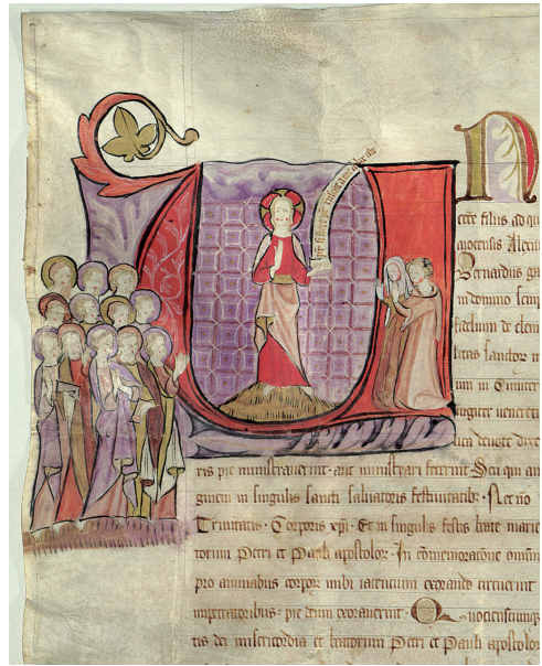
図7 個別的な動機で作成された一括贖宥状 (アヴィニョン、1343年1月1日)

第4部では、事例研究として、ラーチェスとプラドのローカルな文書館について紹介する。ラーチェスは南チロルの小村であり、住民はドイツ語を話しているが、1918年以降はイタリア領となっている。この地の貴族であったハインリヒ・フォン・アンネンベルクが1334年に病院を創始して贖宥状を得たのであるが、そのことは門の上に掲示されて訪問者を惹きつけている。1337年と 36 、1338年の贖宥状の現物は 37 、教区の文書館や領主の文書館ではなく、とても小さな市立文書