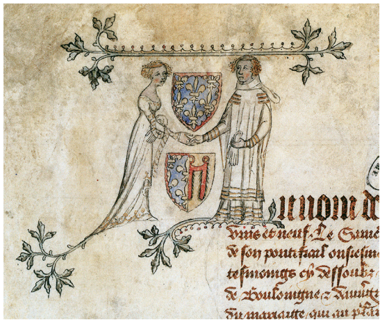
図3 ベリー公ジャンの結婚契約書（パリ、1389年6月5日）