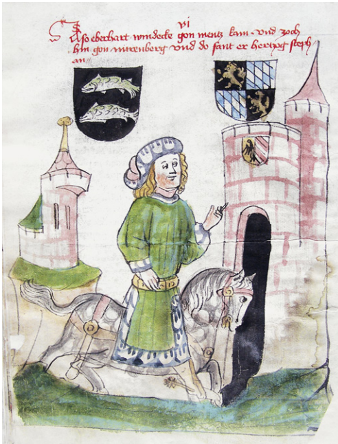
Abb. 4a: Cod. 13.975 (wie Abb. 1), fol. 25v, Eberhard Windeck erreicht Nürnberg (1402).