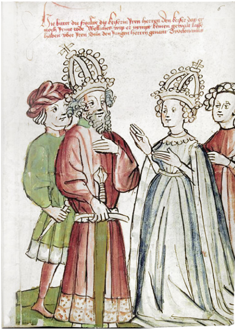
Abb. 8a: Heidelberg, UB, Cpg149 (wie Abb. 6a), fol. 75r.