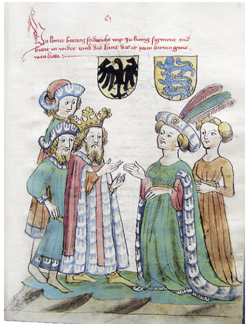
Abb. 8b: Cod. 13.975 (wie Abb. 1), fol. 120r.