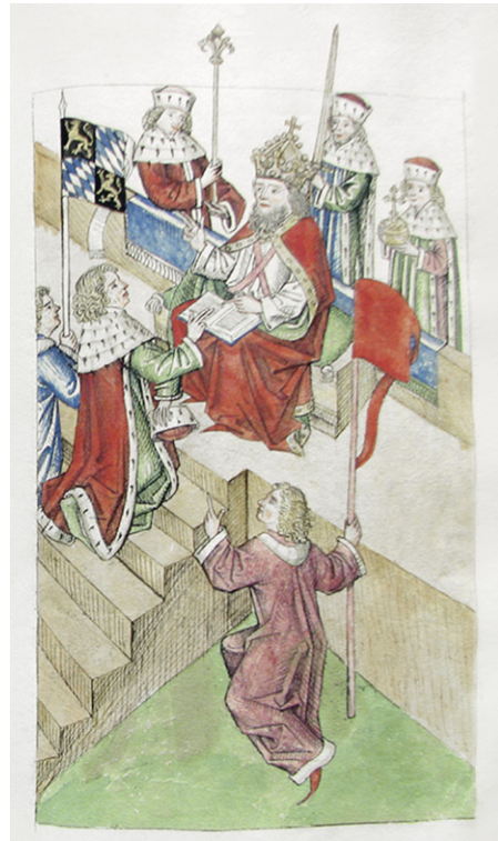
Abb. 13a: Cod. 3044 (wie Abb. 12), fol. 102r; Sigismund belehnt während des Konzils von Konstanz Ludwig von der Pfalz.