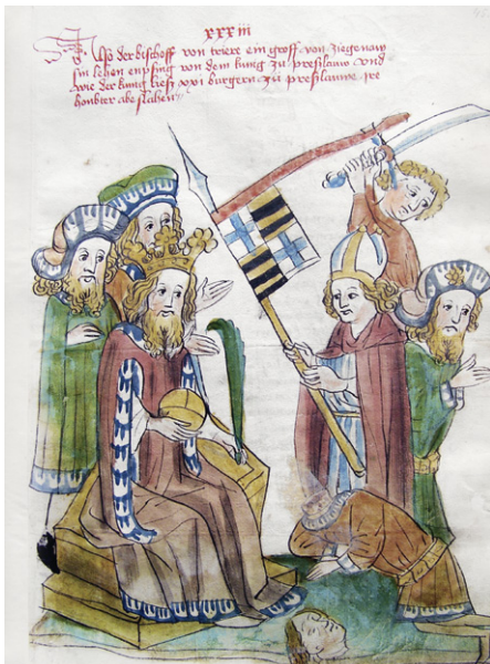
Abb. 13b: Cod. 13.975 (wie Abb. 1), fol. 45r; Sigismund belehnt während des Breslauer Reichtags den Trierer Erzbischof Otto von Ziegenhain und lässt (einen) Breslauer Bürger enthaupten.