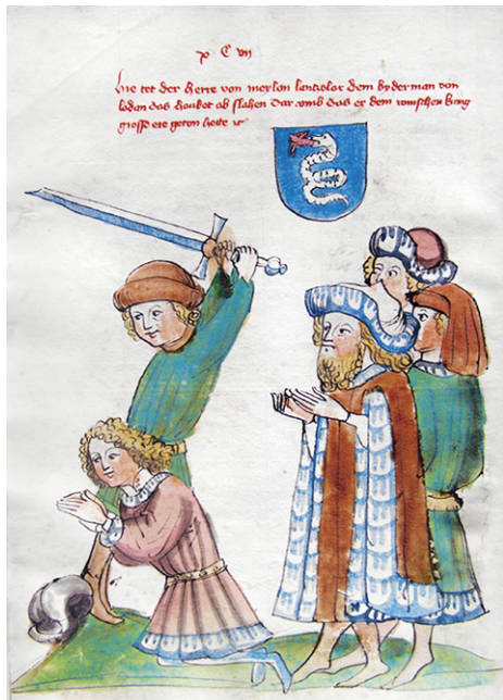
Abb. 9b: Cod. 13.975 (wie Abb. 1), fol. 115v; Der Herzog Filippo Maria Visconti von Mailand läßt Lantzelor (recte: Giovanni da Vignate von Lodi) enthaupten (1415).