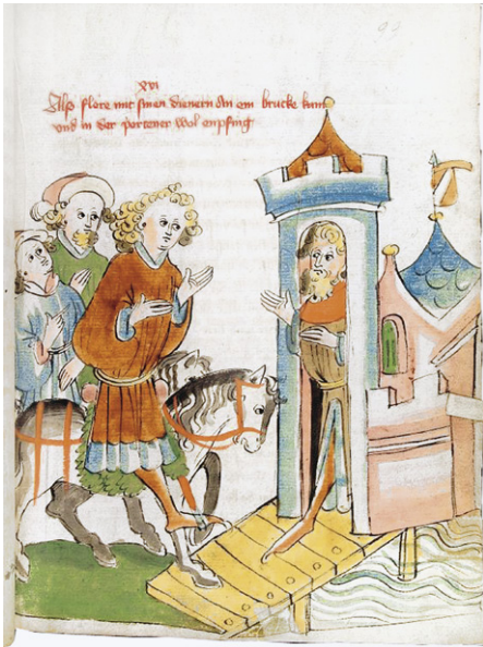
Abb. 7a : Heidelberg, UB, Cpg 362 (wie Abb. 4b), fol. 99r.