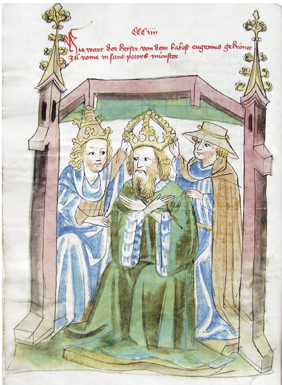
Abb. 16a: Cod. 13.975 (wie Abb. 1), fol. 356v, Krönung Sigismunds zum Kaiser durch Papst Eugen IV. in St. Peter.