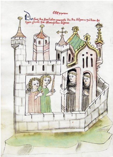
Abb. 10a: Cod. 13.975 (wie Abb. 1), fol. 381v, Prozession von Pilgern mit Kerzen im Chor der Grabeskirche in Jerusalem.