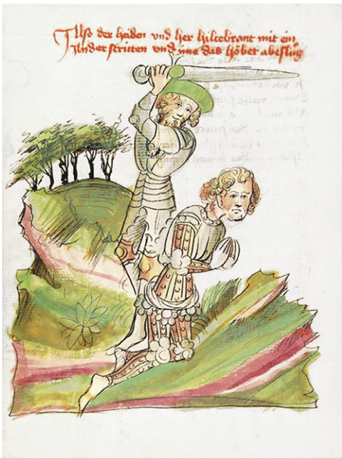
Abb. 9d: Heidelberg, UB, Cpg 324, Virginal, fol. 14v, Werkstatt Diebold Lauber, um 1445/50.