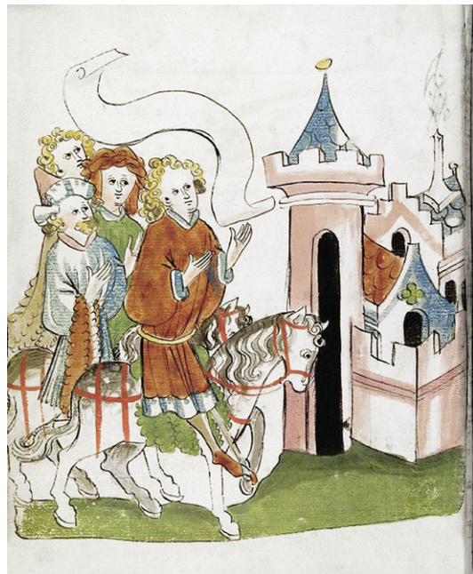
Abb. 4b: Heidelberg, UB, Cpg 362, Konrad Fleck, Flore und Blanschefur , fol. 1v. Werkstatt Diebold Lauber, um 1440/45.