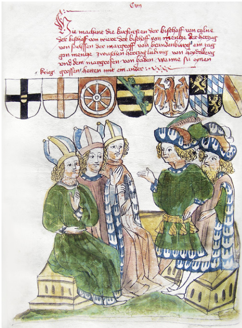
Abb. 2a: Cod. 13.975 (wie Abb. 1), fol. 127v, die Kurfürsten tagen in Mainz über den Streit zwischen Pfalzgraf Ludwig und Markgraf Bernhard von Baden.