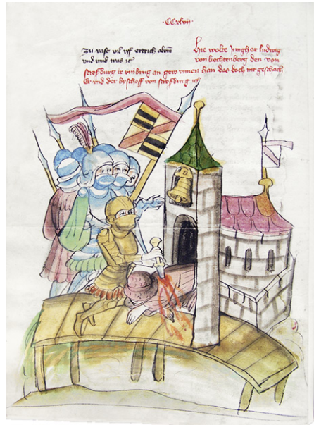
Abb. 7b: Cod.13.975 (wie Abb. 1), fol. 271v.