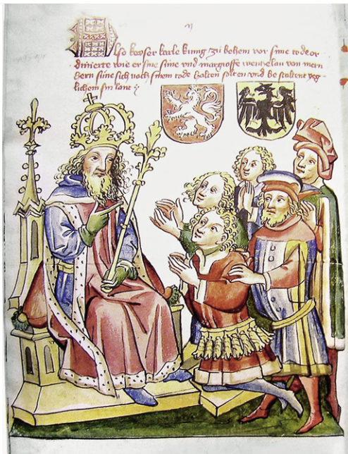
Abb. 3b: Ehem. Irland (wie Abb. 2b), fol. 2v; Thema wie Abb. 3a.