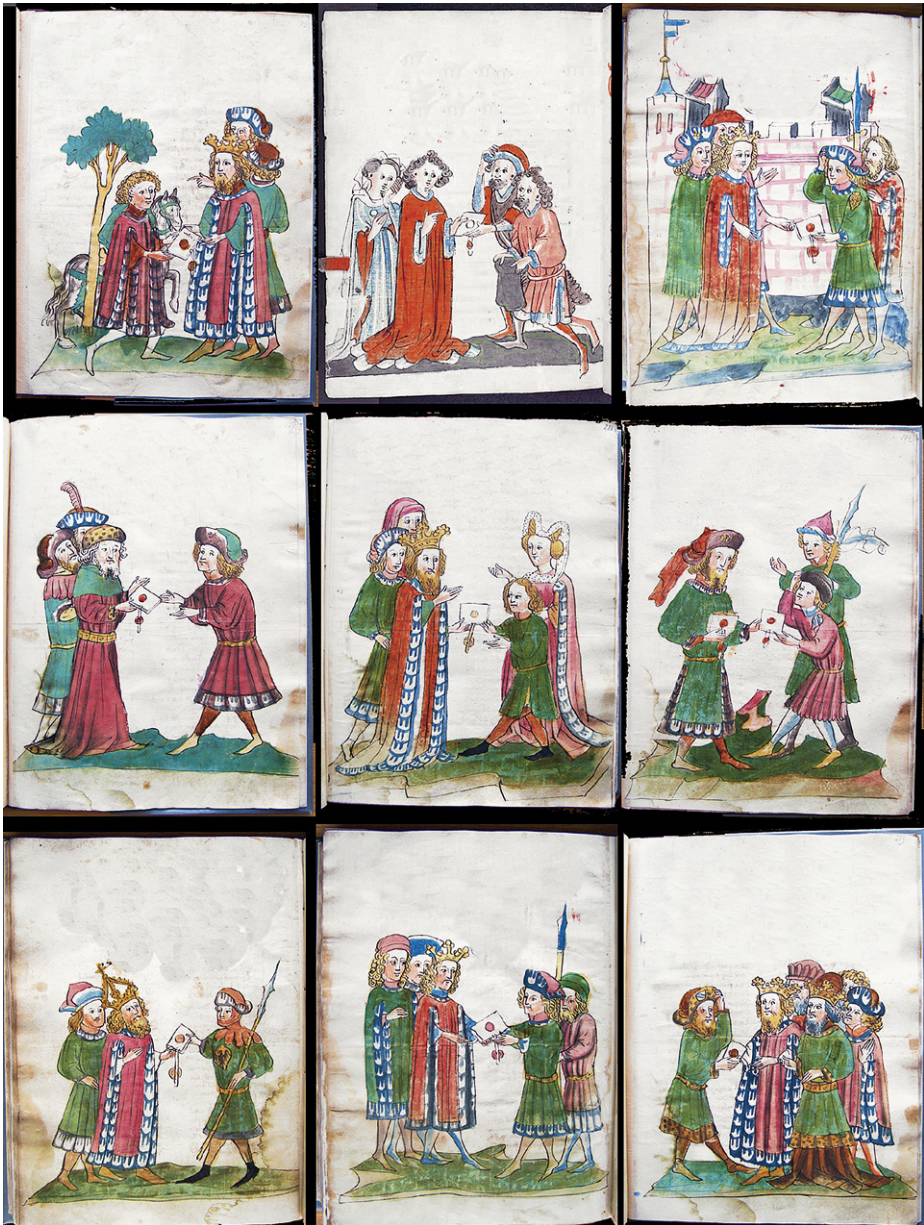
Abb. 5: Urkundenübergaben aus Cod. 13.975 (wie Abb. 1); die 2. Szene aus Heidelberg, UB, Cpg 362 (wie Abb. 4b), fol. 201v; Überschriften und Wappen wurden abgedeckt.