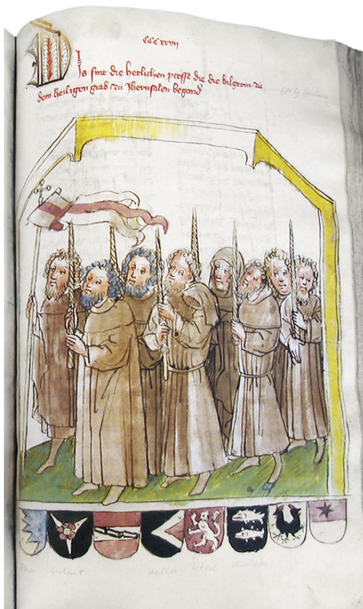
Abb. 11: Ehem. Irland, Privatsammlung, Eberhard Windeck, Sigismundbuch, fol. 236r; Thema wie Abb. 10a. Werkstatt Diebold Lauber, um 1445/50.