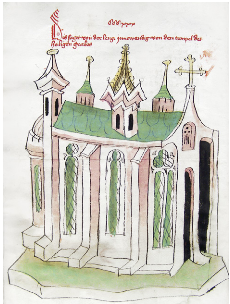
Abb. 10b: Cod. 13.975 (wie Abb. 1), fol. 384v, Außenansicht der Grabeskirche.