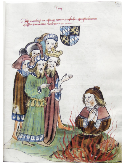
Abb. 15b: Cod. 13.975 (wie Abb. 1), fol. 129r, Verbrennung des Jan Hus.