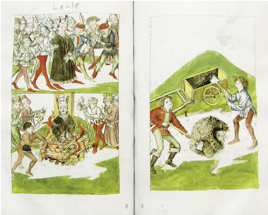
Abb. 15a: Cod. 3044 (wie Abb. 12), fol. 81v–82r, Jan Hus wird zum Richtplatz geführt, verbrannt und seine Asche weggeschaufelt.