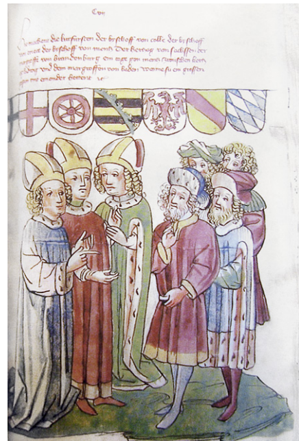
Abb. 2b: Ehem. Irland, Privatsammlung, Eberhard Windeck, Sigismundbuch, fol. 103r; Thema wie Abb. 2a, Werkstatt Diebold Lauber, um 1445/50.