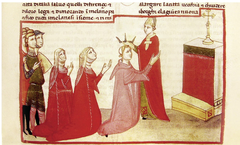
Abb. 17b: Rom, Città del Vaticano, BAV, Ms. Chigi L.VIII. 296, fol. 199r; Thema wie Abb. 17a. Florenz, um 1362 (?).