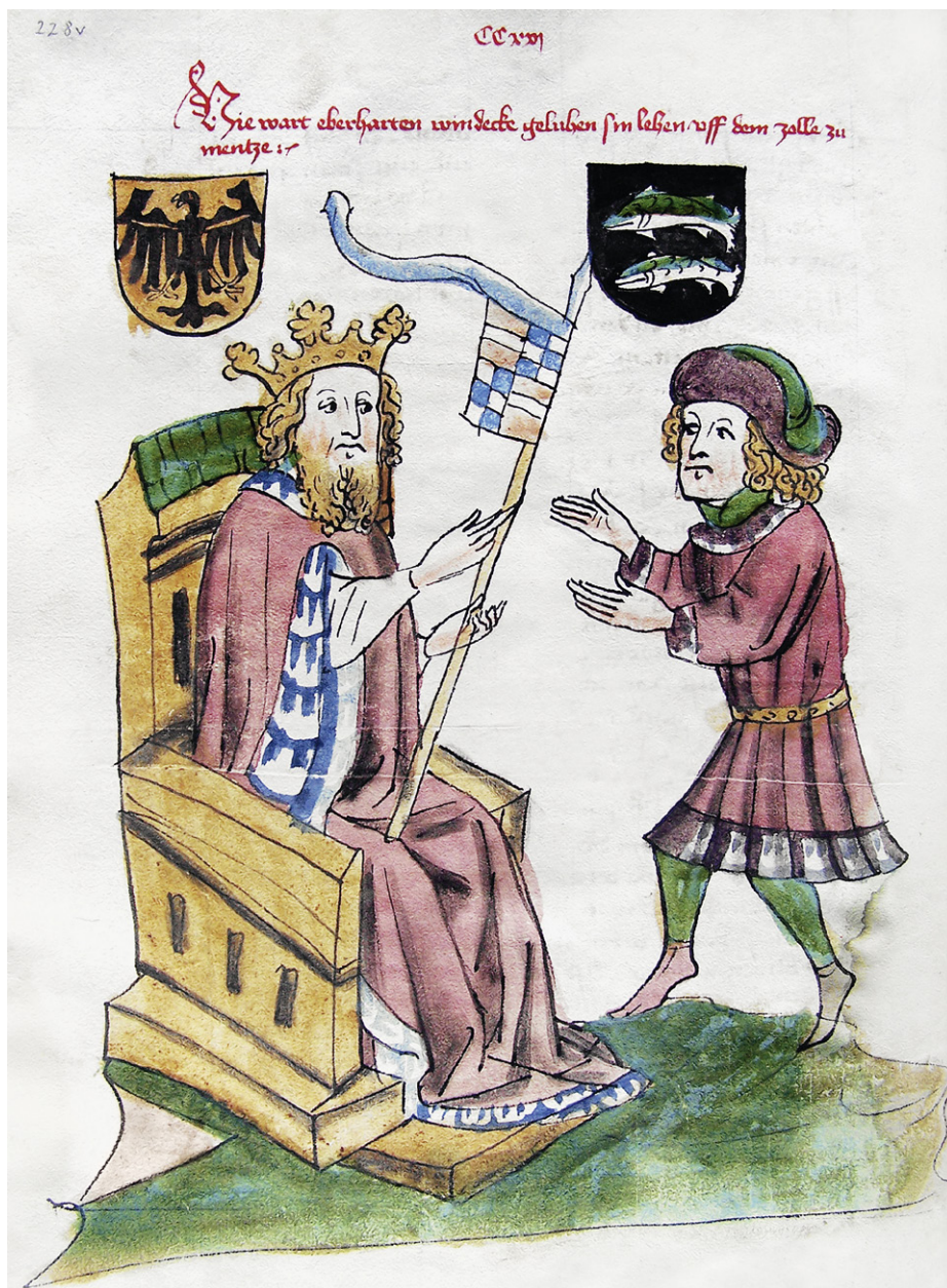
Abb. 1: Wien, ÖNB, Cod. 13.975, Eberhard Windeck, Sigismundbuch, fol. 228v; Windeck erhält von Sigismund ein Lehen auf den Zoll von Mainz. Werkstatt Diebold Lauber, 1447.