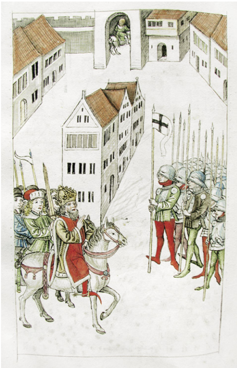
Abb. 14a: Cod. 3044 (wie Abb. 12), fol. 112v; Sigismund stiftet Frieden zwischen den Herzögen Heinrich der XVI. von Landshut und Ludwig VII. von Bayern-Ingolstadt.