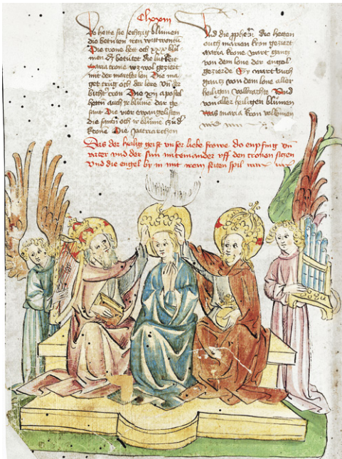
Abb. 16c: Zürich, Zentralbibliothek, C 5, Historienbibel, fol. 398v. Werkstatt Diebold Lauber, um 1430/40.