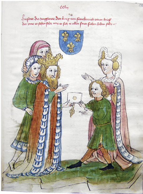
Abb. 8c: Cod. 13.975 (wie Abb. 1), fol. 281r.