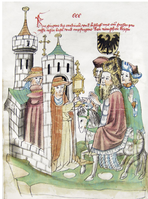
Abb. 6b: Cod. 13.975 (wie Abb. 1), fol. 351v, Kardinäle des Basler Konzils empfangen den Kaiser vor der Stadt (1433).