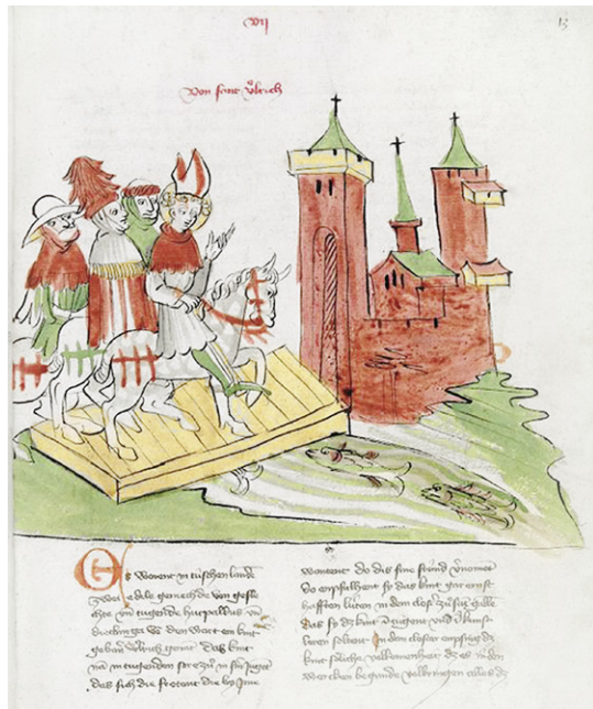
Abb. 7c: Heidelberg, UB, Cpg144, Elsässische Legenda aurea, fol. 13r, hl. Ulrich, Werkstatt von 1418, Straßburg, 1419.