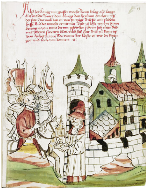
Abb. 6a: Heidelberg, UB, Cpg 149, Die sieben weisen Männer, fol. 59r; das Heiltum wird einem König, der Rom belagert, präsentiert. Werkstatt Diebold Lauber, um 1455.