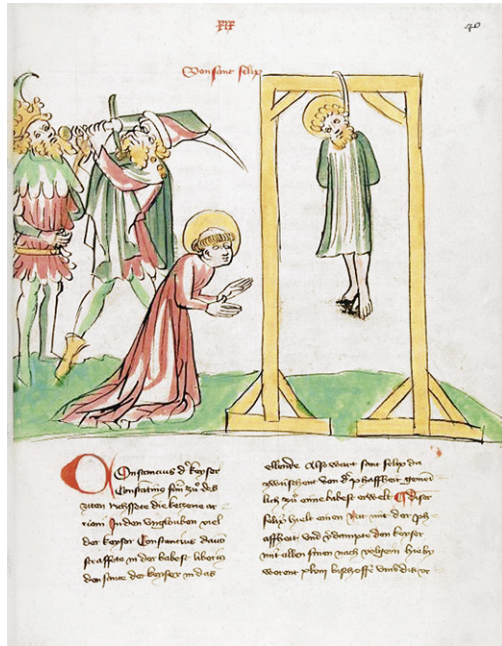
Abb. 9c: Heidelberg, UB, Cpg 144 (wie Abb. 7c), fol. 40r.