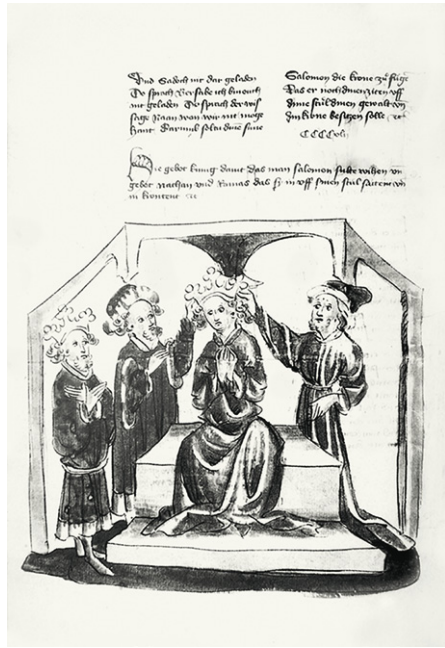
Abb. 16b: Bonn, ULB, Ms. S 712, Historienbibel, fol. 304v. Werkstatt Diebold Lauber, um 1440.