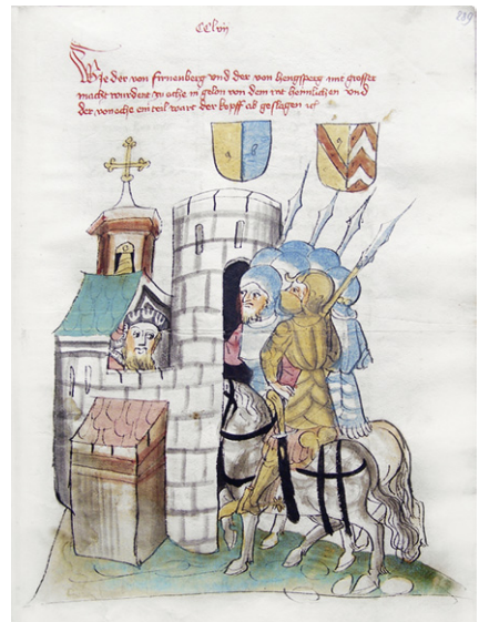
Abb. 14b: Cod. 13.975 (wie Abb. 1), fol. 289r; die Herren von Virneburg und Hengsberg reiten in Aachen ein.