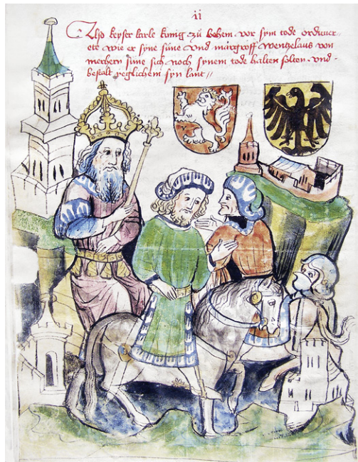
Abb. 3a: Cod. 13.975 (wie Abb. 1), fol. 20v; Kaiser Karl IV. teilt sein Reich unter seinen Erben.