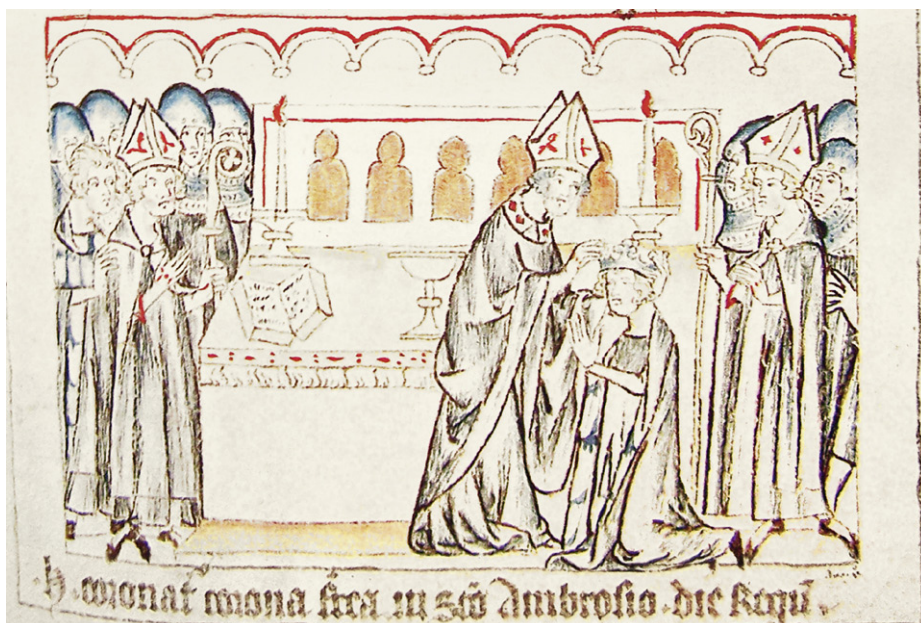
Abb. 17a: Koblenz, Landeshauptarchiv, I C 1, fol. 9r; Heinrich VII. wird mit der eisernen Krone gekrönt. Trier, um 1330/40.